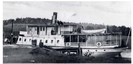
Ång. "Åkers Kanal" vid Brottby.