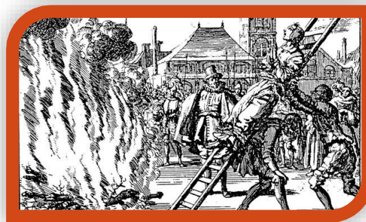
Häxbränning i Amsterdam, Holland

Det stora oväsendet eller Det stora blåkullabullret var en masshysteri som under åtta år av Karl XI:s regeringstid, mellan 1668 och 1676, förorsakade en stor mängd häxprocesser i Sverige. Det ledde till nästan 300 människors död innan det stoppades. Det var under denna tid som majoriteten av Sveriges häxprocesser hölls. Av de omkring fyrahundra personer som avrättades för trolldom i Sverige mellan 1492 och 1704, avrättades omkring trehundra mellan 1668 och 1676.