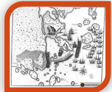
Belägringen av Helsingfors 1713. Ryskt kopparstick

Ett ryskt anfall mot Finland började i mitten av augusti 1712, men längre än till Kymmene älv kom den ryska armén inte. Här hade den svenska armén en stark ställning och den ryska befälhavaren gav främst av brist på försörjning order om reträtt. Det planerade anfallet från s. Sverige mot Stockholm förverkligades aldrig, och därför blev Peter den store allt mer övertygad om att ett anfall mot den svenska huvudstaden endast kunde ske över Finland. Kampanjen 1712 hade visat att en armé i Finland inte kunde operera och underhållas utan hjälp av den ryska galärflottan.