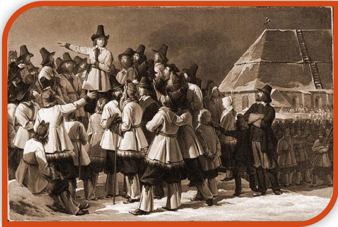
Gustav Vasa talar till dalkarlarna målning av Johan Gustav Sandberg