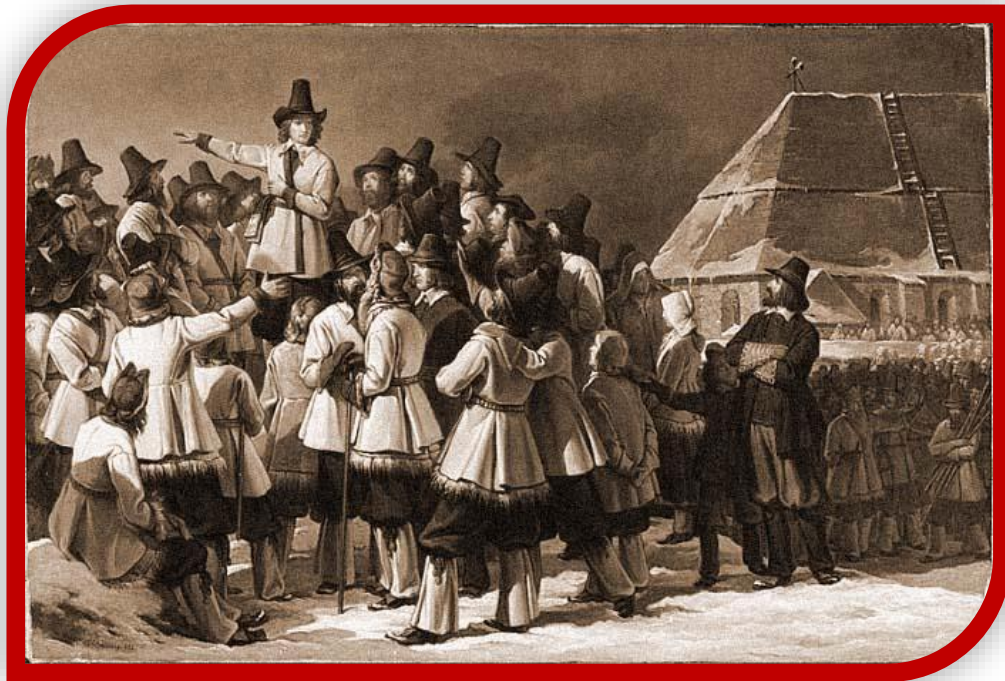
Gustav Vasa talar till dalkarlarna målning av Johan Gustav Sandberg

"Bara den som känner sin bakgrund har en framtid." Wilhelm von Humboldt (1767-1835)