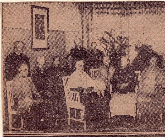
De alla äldsta på hemmet.