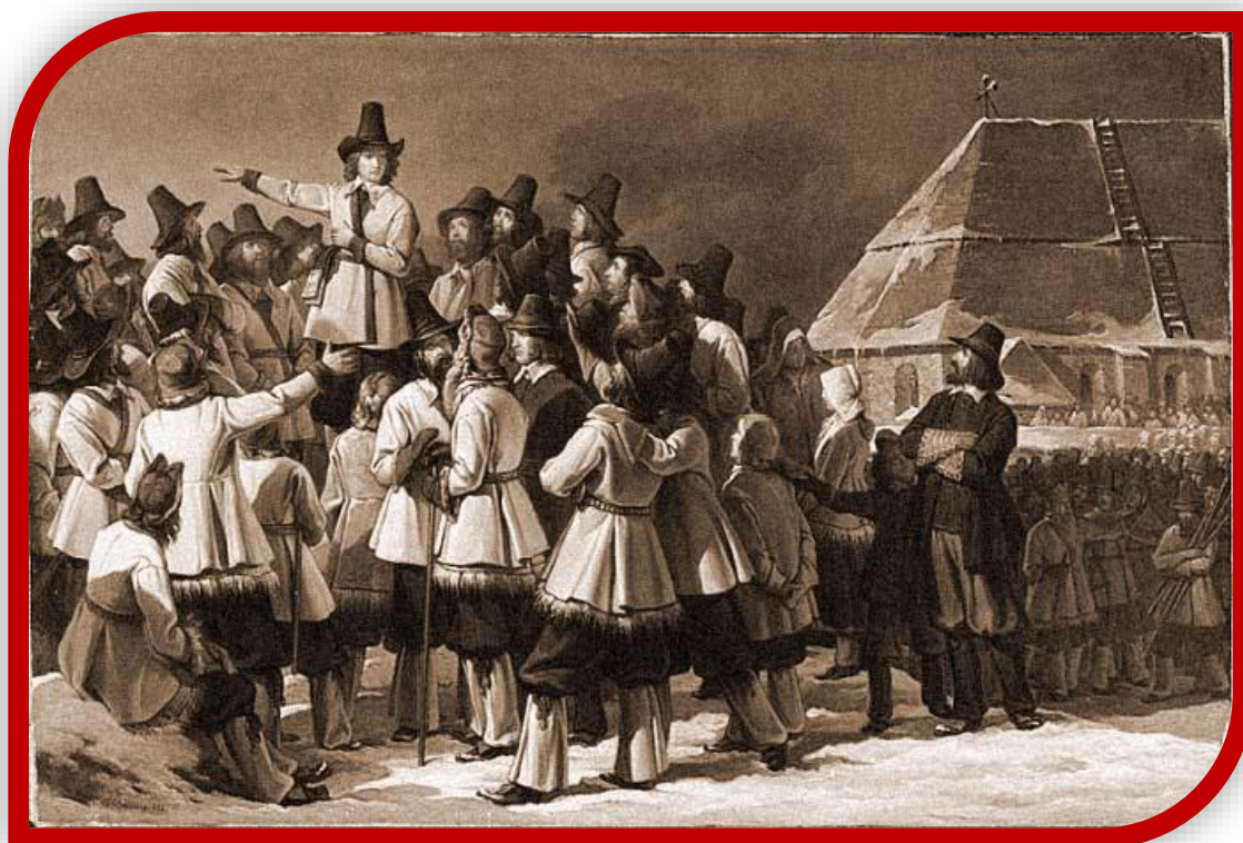
Gustav Vasa talar till dalkarlarna målning av Johan Gustav Sandberg

"Bara den som känner sin bakgrund har en framtid."