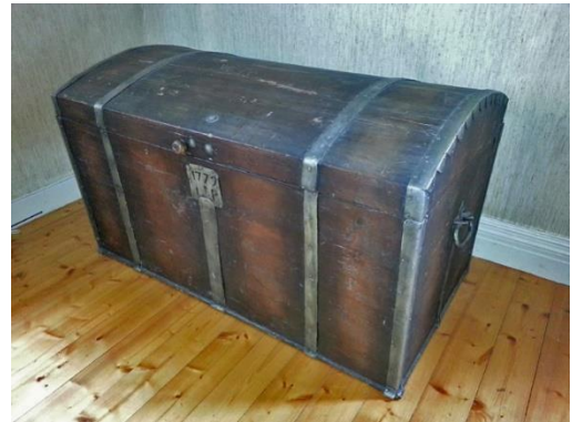
Figur 6 Rotekistan

Därför hade de s. k. rotekistorna tillkommit. De skulle utgöras av en tät kista ställd på en halv alns höga fötter, på det att rättorna icke måtte kunna taga håll på kistans botten "skolandes persedlarna en gång varje månad uttagas och visiteras när vackert och torrt väder inträffar". Kistan skulle vårdas en av rotehållarne benämnd rotemästare. I allmänhet var det bonden på huvudroten som fick detta uppdrag.