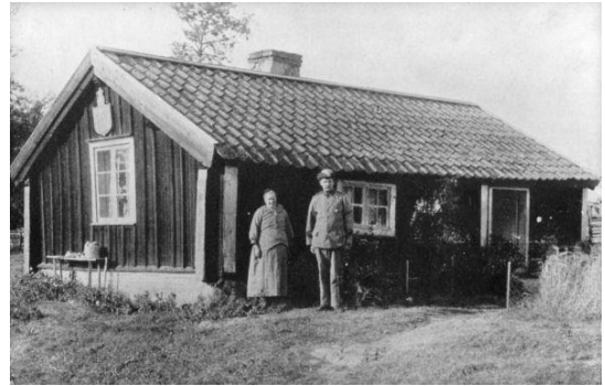
Figur 4 Soldattorp

Ofta blev han sviken i sina förhoppningar, då han såg stugan. Ofta var den belägen långtifrån farbara vägar, och det var ett problem huru man skulle kunna komma dit vår och höst. Och inuti trångt och lågt i taket med ett stort rum om 4 gånger 4 m, försett med spisel, bakugn och vindspjäll. I andra änden av bostaden en kammare utan eldstad och en förstuga, där kläderna skulle förvaras. I stora rummet två små fönster och i kammaren ett. Det var allt. Men var det väl underhållet kunde man klara sig skapligt. En grenadjär beskriver sitt torp så här. "Bostaden var ett stort rum och ett litet kök. Det fanns ingen ingång till köket ifrån förstugan. För att komma till köket måste man gå genom rummet. Var familjen stor var det svårt att få rum, ty i köket kunde ingen säng få plats. Skafferi saknades. Vinden fick duga till detta ändamål". En annan grenadjär, från 3öderköpingstrakten berättar om sitt torp: "Min blivande bostad innehöll bara ett eldrum och där låg spjället nedfallet i en spisel med flera hål. Så var där ett litet kyffe i jämter rummet att begagna som visthusbod. Hur det för övrigt såg ut, vill jag inte beskriva va. Byggnaderna kunde ju gå an som dåliga sommarbostäder, men vintern emotsåg jag med fasa. När jag sa åt bonden att jag behöver ett spjäll, så blev svaret att det behövs inget spjäll den här årstiden".