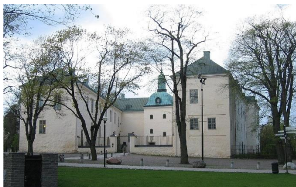
Figur 3 Linköpings slott

läkarundersökningar av rekryter. Att bli antagen i kronans tjänst 1872 var inte så svårt, skriver en gammal indelt, bara man inte var puckelryggig eller gick på träben. Slutklämman på undersökningen blev oftast "approberas".