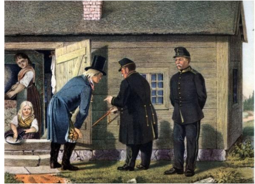
Figur 5 Militär syn av torpet

När knekten bott tre år på sitt torp, skulle han få det synat. Torpsyn förrättades antingen av kompch eller en löjtnant i närvaro av en underofficer, vilken förde protokollet samt naturligtvis knekten och hrols rust-eller rotehallare. Dessa voro beordrade att med skjuts hämta off vid närmaste torp. I regel stod syneförrättaren på knektens sida. Många stridigheter mellan knekt och bonde hade sitt upphov i syneförrättningarna. Rotebönderna höllo ihop och ville icke förbättra torpet, medan knekten drog fram alla skavanker han upptäckt.