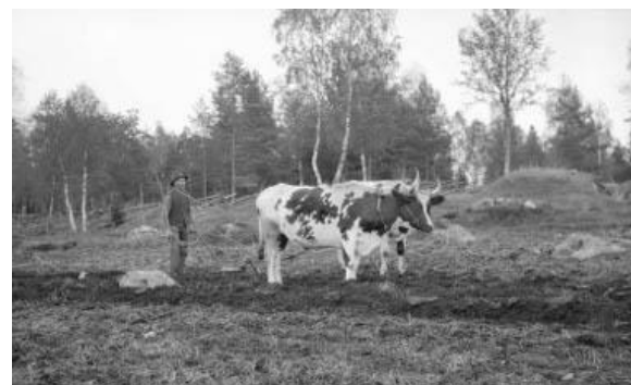
Figur 11 Vardagen efter färdig tjänat

Alltnog. Mötestiden gick fort och snart var det åter dags att bege sig hem till torpet och lägga ned munderingen i rotekistan och utbyta geväret mot plogen. Nu blev det att åter börja tvista med ogina rote- och rusthållare. Nu blev det att åter sjunga den höstliga refrängen "När jag behövde nödigt ök till harvning, så skulle