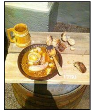
Figur 9 Soldatmat

Matordningen var enkel. Var femte dag provianterade man korpralskapsvis. Därvid erhöi varje korpralskap råvaran för förvaring. Det var proviant för två mål ärter och fläsk och tre mål "sluring" -det senare en soppa kokt på nötkött och korngryn. Till kvällsmål fick man korngryn att koka gröt på. Mjök bestod icke kronan. Det fick man köpa av bondpigorna i trakten. För tillredningen av frukostmålen utdelades 2 ankarstockar, 3 sillar, 1 bit ost och 12 sockerbitar. Frukostmålingredienserna förvarades av knekten själv i tältet.