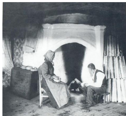
Figur 1 soldattorpet en jul