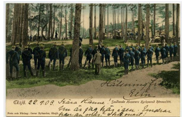
Figur 10 Kyrkparaden

På söndagarna var det kyrkparad kl. 11. Då ställde kompanierna upp i öppen fyrkant ute på slätten. En stor mängd civila åskådare hade alltid mött upp vid dessa tillfällen. Efteråt var det ett brokigt liv ute i lägret. Klockskojare göra affärer, dragharmonika och munspel höras ur tälten, karusellerna snurra nere i samhället och regementsmusiken spelar. Men all fröjd har en ände. Så ock denna. Kl. 4 trummades på första och blåstes på andra regementet till uppställning. Nu skulle söndagsexercisen avverkas under de två följande timmarna - för att riktigt helga sabbatsdagen, som en knekt något syrligt yttrar i slutet av 1880-talet. Men åskådare hade man och många av knektarna tog nog i mer än vanligt, när deras anhöriga tittade på