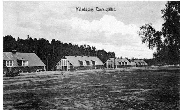
Figur 8 Övningsheden

Mot slutet av 1700-talet kom den första bebyggelsen på Malmen. Förläggningmöjlighet inomhus fanns ännu icke utan här måste man tälta. Vid slutet av 1800-talet tedde sig bebyggelsen så här: