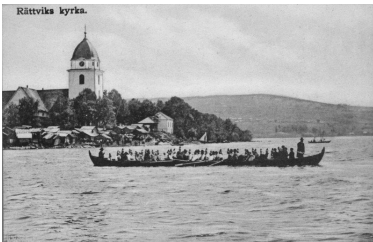
Rättviks kyrka, Dalarnas län.