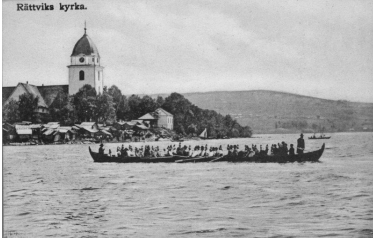
Rättviks kyrka, Dalarnas län.

Generalmönstring (31) 1863-07-08 i Övningsheden Stora Tuna Kopparbergs län (W), Militärt övningsområde .5