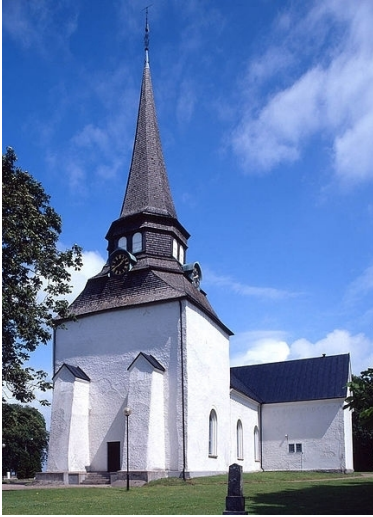
Veinge kyrka, Hallands län.

Asked som soldat (54) 1876-06-15 i Övningsheden Kronobergshed, Konobergs län (G), Militärt övningsområde .5