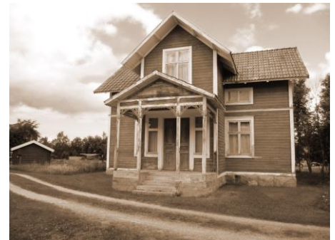
FIGUR 6 ELFDAHLSGÅRDEN I BACKA