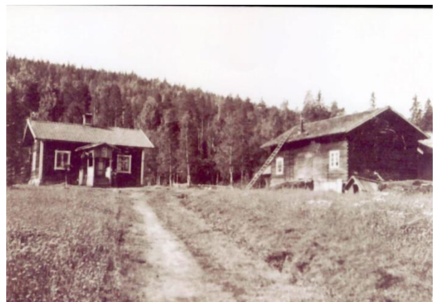
FIGUR 4 ETT TYPIKT SOLDATTORP

Det var allt. Men var det väl underhållet kunde man klara sig skapligt. En grenadjär beskriver sitt torp så här. "Bostaden var ett stort rum och ett litet kök. Det fanns ingen ingång till köket ifrån förstugan. För att komma till köket måste man gå genom rummet. Var familjen stor var det svårt att få rum, ty i köket kunde ingen säng få plats. Skafferi saknades. Vinden fick duga till detta ändamål". En annan grenadjär, från Zöderköpingstrakten berättar om sitt torp: "Min blivande bostad innehöll bara ett eldrum och där låg spjället nedfallet i en spisel med flera håll. Så var där ett litet kyffe i jämter rummet att begagna som visthusbod. Hur det för övrigt såg ut, vill jag inte beskriva va. Byggnaderna kunde ju gå an som dåliga sommarbostäder, men vintern emotsåg jag med fasa. När jag sa åt bonden att jag behöver ett spjäll, så blev svaret att det behövs inget spjäll den här årstiden".