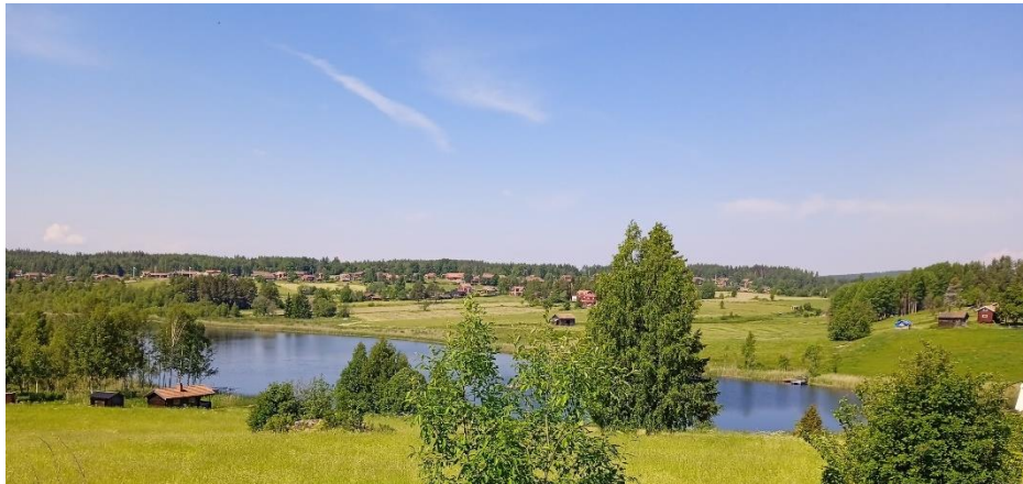
FIGUR 5 VY FRÅN BACKA BY MOT BYN VÄSTGÄRDE