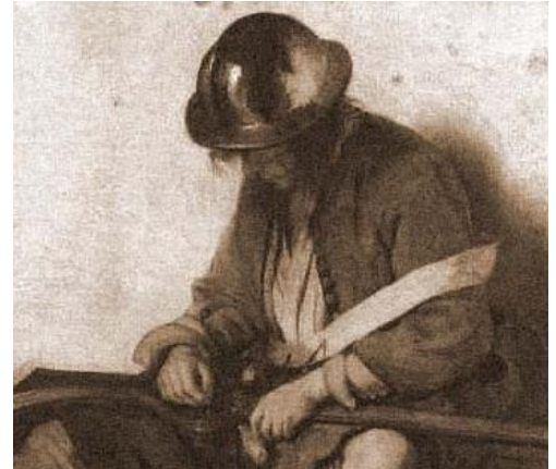
FIGUR 3 EN SLAGEN SOLDAT

Men vi återgår till knekten och approbationen (Godkänd). Sitt namn har han fått, och det är ofta samma som hans företrädare på torpet haft. Kontraktet är klart, legan likaså, nu har han bara att taga sitt nya hem i besittning.