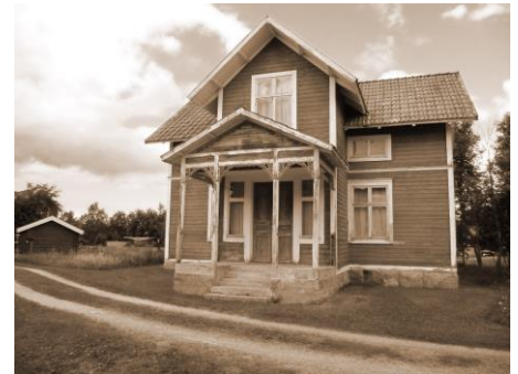
FIGUR 7 ELFDAHLSGÅRDEN I BACKA

04.00 Revelj 04.30 – 05.00 Korum 05.00 – 08.00 Arbete 08.00 – 09.00 Frukostrast 09.00 – 12.00 Arbete 12.00 – 13.30 Middagsrast 13.30 – 16.30 Arbete 16.30 – 17.00 Aftonvard 17.00 – 20.00 Arbete 20.30 – 21.00 Korum och Tapto