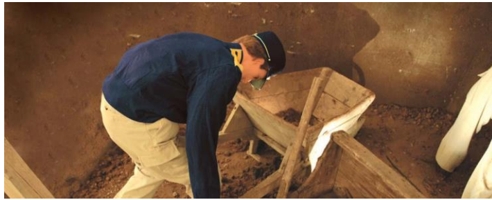
FIGUR 9 ARBETANDE SOLDAT VID GÖTA KANALBYGGET

Korum kallas den gudstjänst som morgon och förrättats vid varje svensk trupp och bestod psalmvers sjöngs före och efter en bön upplästes av någon bland manskapet. gudstjänstens slut utropade befälhavaren "Gud bevara konungen och fäderneslandet!", vilka ord upprepades Korum förekommer emellanåt den svenska försvarsmakten, främst trupp i utlandstjänst. Tapto militär signal som innebär återgång till kasern eller bivack för natten. Den kan ges med jägarhorn, signaltrumpet eller trumma. Ursprungligen innebar det också att ölutskänkningen avslutades genom att marketentaren satte tappen till.