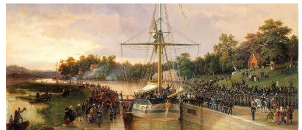
FIGUR 8 INVIGNINGEN AV GÖTA KANAL 1832