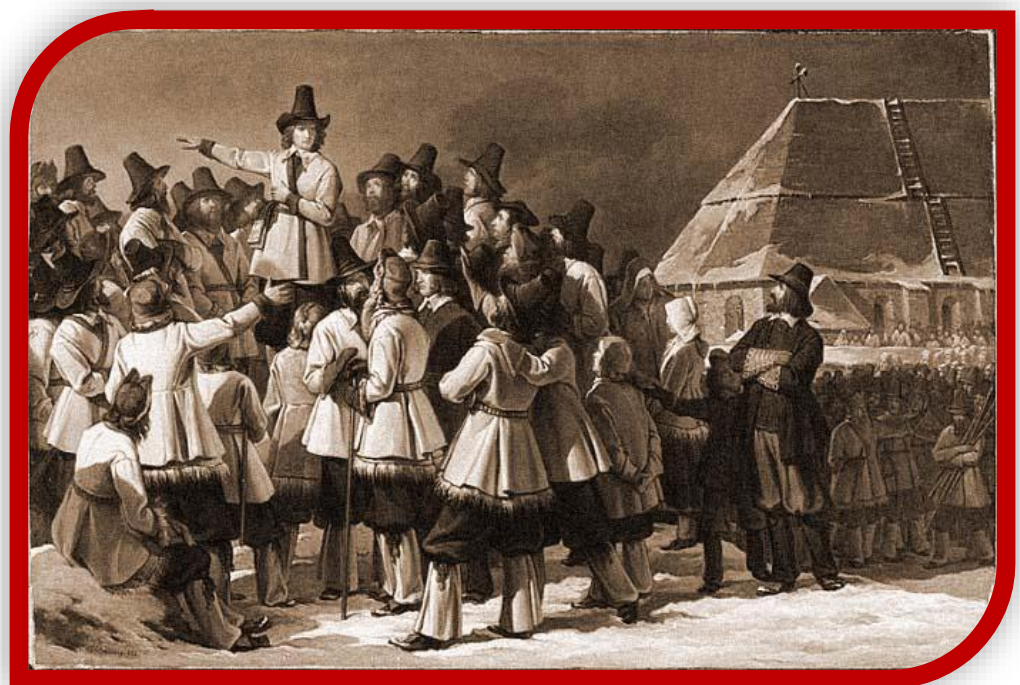
GUSTAV VASA TALAR TILL DALKARLARNA MÅLNING AV JOHAN GUSTAV SANDBERG

"Bara den som känner sin bakgrund har en framtid." Wilhelm von Humboldt (1767-1835)